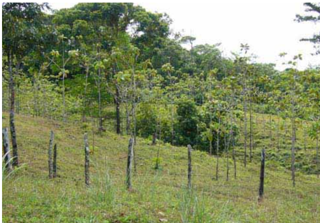
Las plantaciones forestales están en aumento en esta subcuenca y van reemplazando a las fincas ganaderas

En comunidades como Cerro Azul, Alto El Chorro (Ella-Drúa), Nuevo Veraguas, la mayor parte de la tierra está ocupada por rastrojos, matorrales, paja blanca y restos de bosques muy alterados. También hay potreros de unos tres años a diez años; hay cultivos de maíz, ñame, oteo, frijol, poroto, plátano, hortalizas, tomate, ají, pepino, y una pequeña parcela de café.