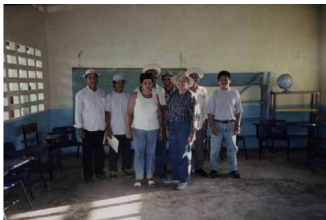
Delegados y delegadas del tramo alto de la subcuenca del río Gatún

Al final de esta etapa fue la selección de delegados comunitarios, tratando de que hubiera igual oportunidad para hombres y mujeres, así como de adultos y jóvenes. Esta escogencia se dio el día 24 de febrero de 2006 en Santo Domingo. Los delegados escogidos fueron los siguientes: (cuadro No. 8).