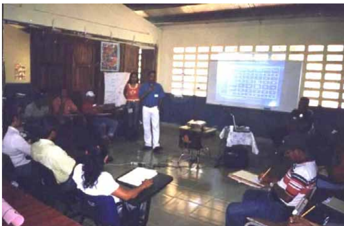
Taller de validación del diagnóstico con las comunidades del tramo bajo del río Gatún

Realización de un diagnóstico: Al igual que en el tramo alto, los talleres se realizaron en dos jornadas de 8 horas. La participación total fue de 183 personas.