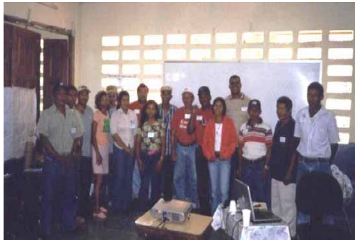
Delegados comunitarios escogidos al CL del tramo bajo

Selección de Delegados Comunitarios: El proceso de participación social para la organización del comité local se completó con la selección de los delegados comunitarios principales y suplentes en el taller de validación llevado a cabo el 19 de marzo de 2006, en la escuela primaria de río Gatún.