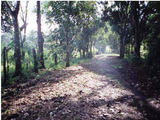
La mayor parte de los caminos en el tramo bajo de esta subcuenca son de tierra y necesitan mejor mantenimiento

Para ir a Alfragía, las personas tienen que abordar un bote en Limón y luego caminar por un camino de tierra durante quince minutos. Había un camino de penetración construido por el ejército norteamericano; en la actualidad sólo lo utilizan los que van a pie a Frijolito, en Buena Vista. Para ir a Alto El Chorro (Ella-Drúa), las personas tienen que abordar un bote y atravesar el río Gatún.