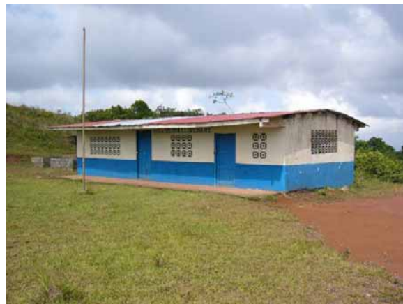
Escuela de Sierra Llorona que cuenta solo con 2 aulas para atender los 6 grados

Educación / Alfabetismo: La población de edad escolar (menores de 15 años) es de 56, de esto más del 93.1 % ha logrado insertarse en el sistema educativo, mientras que el 6.9 % es analfabeta. El acceso de la población al sistema escolar se da primordialmente asistiendo a los cuatro centros educativos primarios de MEDUCA ubicados en Aguas Claras No. 2, Santo Domingo y Sierra Llorona. Para continuar estudios secundarios hay que trasladarse hasta Sabanitas, Buena Vista y Colón centro, lo que demora hasta una hora y media a pie desde las comunidades.