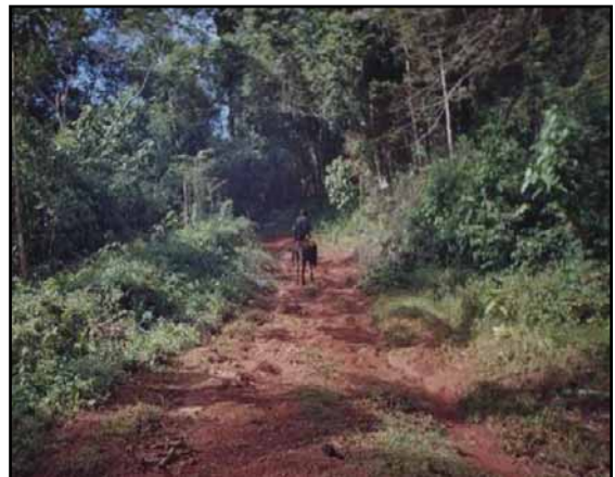
La falta de mantenimiento de los caminos como el que va a Aguas Claras No.2 dificulta la comunicación entre las comunidades

Transporte: El sistema de transporte es deficiente por no existir calles apropiadas para el paso vehicular y en algunos lugares los caminos existentes están en muy mal estado; no hay puentes lo cual pone en peligro la vida de sus habitantes, especialmente niños.