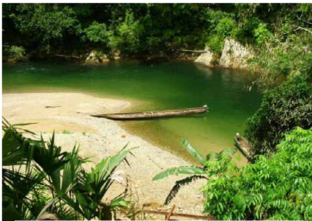
Río Gatún cerca de la comunidad de Ella Drúa o Alto El Chorro

La subcuenca del río Gatún está localizada al extremo nordeste de la Cuenca del Canal. La superficie, hasta su desembocadura, es de 12,973 hectáreas. Se encuentra totalmente en el distrito de Colón, provincia de Colón, recorriendo por 6 corregimientos de ese distrito, siendo estos: Salamanca, Buena Vista, Limón, María Chiquita, Puerto Pilón y Cristóbal.