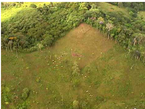
Las fincas ganaderas ocupan una buena porción de la superficie total, pero es una actividad que va disminuyendo

El área ocupada por los poblados, es decir 27.2 hectáreas, representa solamente el 0.2% de toda la superficie de esta subcuenca, lo que indica que está pobremente poblada.