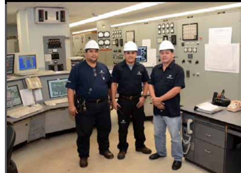
Operadores frente a los monitores de comandos