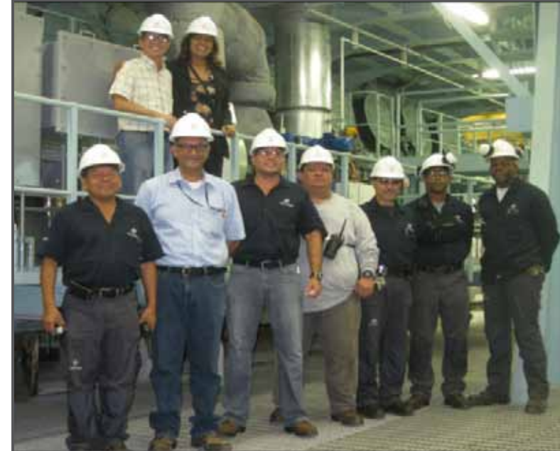
Gerente y supervisores de la planta

Un elemento de suma importancia en la seguridad de la planta, lo constituyen los técnicos de Instrumentación. Estos son responsables de mantener, calibrar y reparar todos los sistemas de control industrial de la Planta Termoeléctrica además de implementar todas las estrategias y lazos de control de procesos que regulan de modo estable y automático los fenómenos físicos necesarios para la generación de electricidad. Su labor es verificar periódicamente la calibración de todos los sistemas de protección que reaccionan a la presión, temperatura, nivel y flujos; verificar también sensores, válvulas actuadoras de control electrónico, neumático e hidráulicos y todos los diferentes equipos y sensores de medición electrónicos, eléctricos, mecánicos y neumáticos, de manera que sus lecturas sean siempre fiables para así poder tomar la decisión correcta, en el momento de hacer uso de los instrumentos de control.